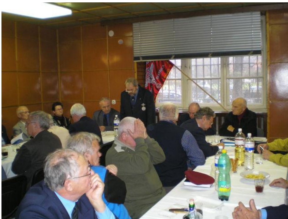
Rokovanie bolo bohaté na diskusné príspevky