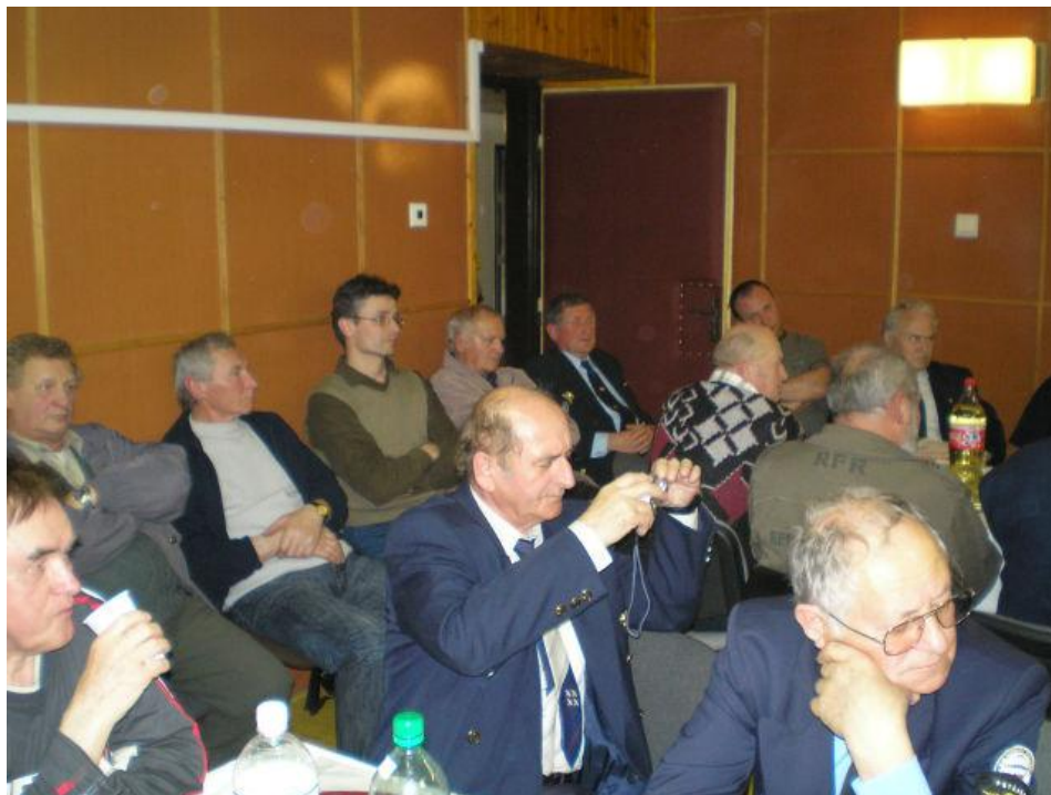
Výročná členská schôdza zaznamenala vysokú účasť členov a hostí